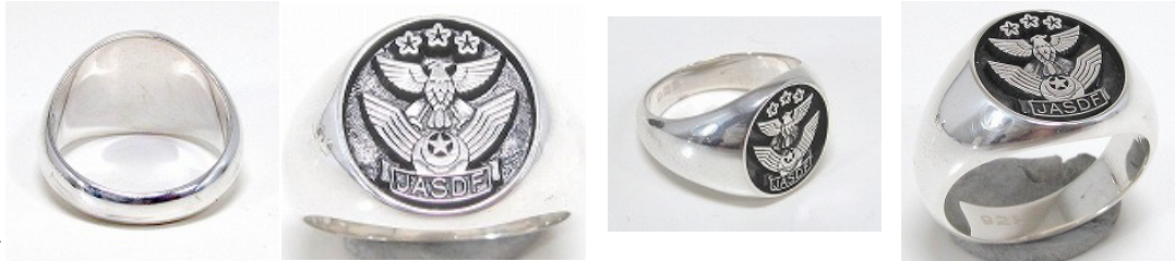
<デザインの仕組み>